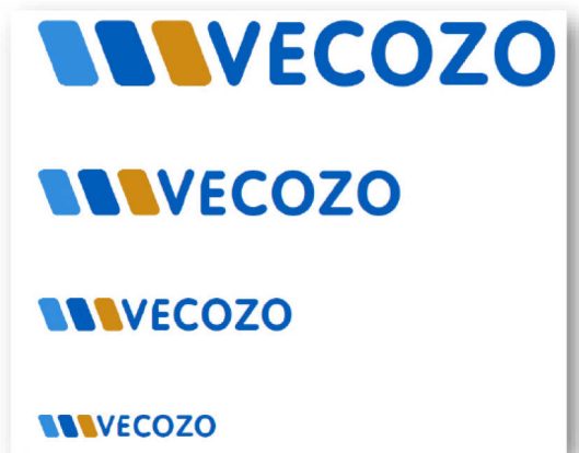
Figuur 1: het logo van VECOZO in diverse formaten

Het logo van VECOZO bestaat uit een woord- en beeldmerk: